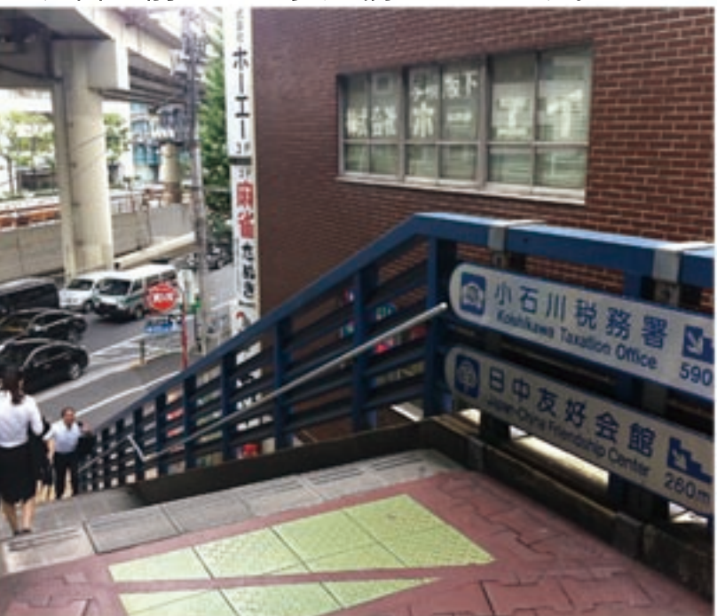
4、左側の階段をおりたら、そのまま進んで下さい。