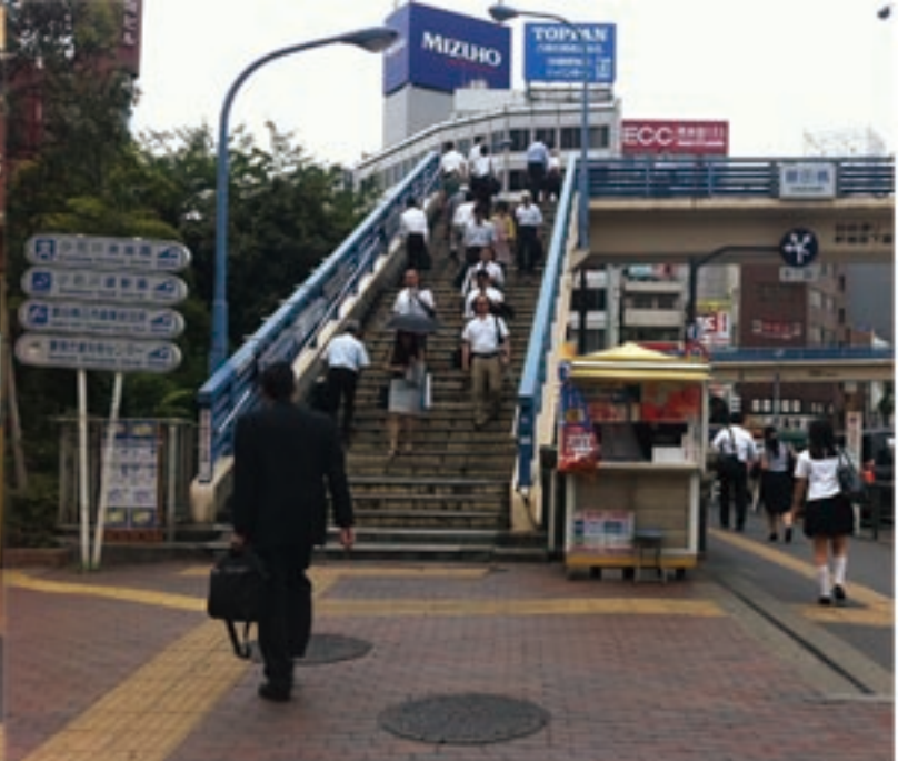
2、目の前にある歩道橋を上ります。