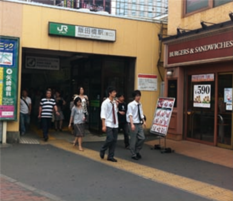
1、JR飯田橋駅東口を出ます。