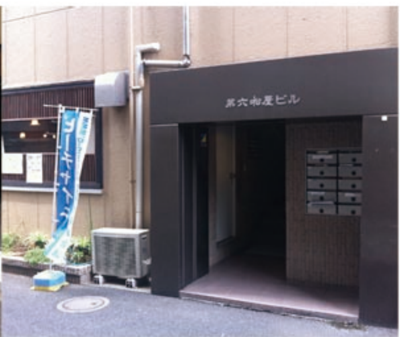
6、南蛮料理屋の角を右に曲がり、すぐ左に見えるビルの二階が ビーチチャイニーズです。