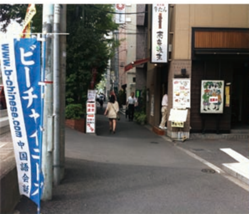
5、そうすると青い旗と南蛮料理屋が見えてきます。